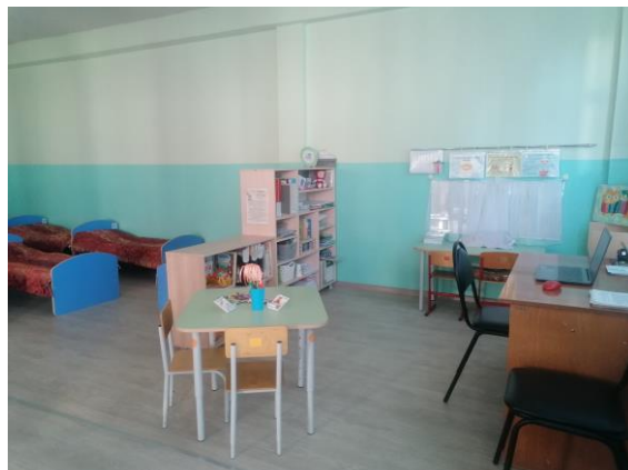
Оснащение логопедического кабинета