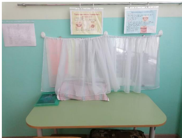
Зона индивидуальной коррекции речи

2. Зона индивидуальной коррекции речи. Здесь располагаются: зеркало 100x55 см; логопедический инструментарий; песочные часы